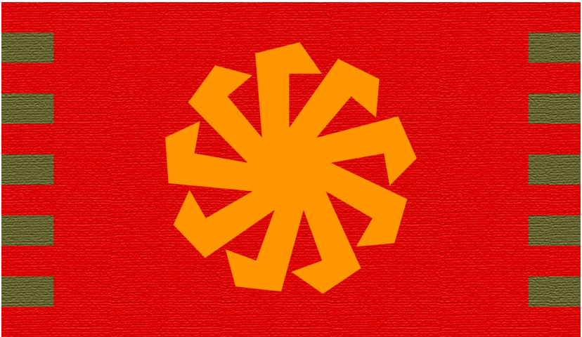
Հայաստանի Թագավորության դրոշը զինանշանով